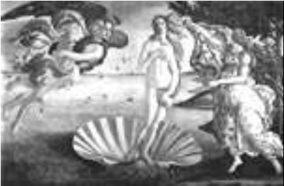
La nascita di Venere

alcune sommità, l'attività interna delle quali ha modellato -nella sua storia geologica- la crosta del pianeta. L'atmosfera è costituita da una miscela gassosa, composta per il 96% di ossido di carbonio e per il 4% circa di azoto. È stata rilevata anche la presenza di biossido di zolfo, ossigeno molecolare, valore acqueo, argo e cripto.