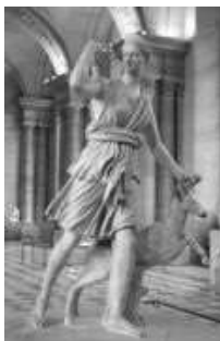
“Diane de Versailles”

CENNI MITOLOGICI. La Luna è sempre stata tenuta in grande considerazione presso tutte le culture antiche. Nella mitologia greca troviamo Artemide, figlia di Zeus e di Leto e sorella di Apollo. Quest’ultimo è il dio della luce solare, mentre Artemide è la dea della luce lunare. Considerata altamente benefica, fu raffigurata armata di arco e di frecce (queste ultime richiamanti i raggi lunari) e si dilettava nella caccia.