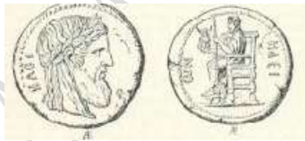
Monete di Elide con la riproduzione dello Zeus di Fidia.

Molto fu scritto intorno all'imponente figura di Zeus, sia dai grandi poeti lirici dell'Ellade, sia dai poeti latini. Anche l'arte statuarica fu piuttosto generosa verso questa divinità. Nella Grecia, il monumento più grandioso, capolavoro dell'arte ellenica e degno di ammirazione, era la statua di Fidia (500-432 a.C.) collocata nel tempio di Olimpia, dove ancora si trovava alla fine del IV secolo d.C. Si dice che fu trasportata a Costantinopoli dove rimase distrutta durante un incendio. Oltre ad un'ampia descrizione scritta, lasciata dallo scrittore greco Pausania, la troviamo sulle monete di Elide coniate ai tempi di Adriano: da una parte c'è l'immagine di Zeus in trono, nella cui mano sinistra regge lo scettro sormontato dall'aquila, e nella destra una piccola Nichea alata, simbolo della vittoria; dall'altra parte è raffigurato solo il capo, di profilo.