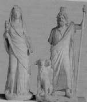
Proserpina e Plutone col cerbero

RICHIAMI MITOLOGICI. Nella mitologia greca lo troviamo col nome di Ades, figlio di Crono e di Rea, quindi, fratello di Zeus: era il dio dell'Ade –detto anche dio degli Inferi– che la tradizione considerava il luogo in cui le ombre dei morti attendevano la rinascita e la risurrezione. Dopo la vittoria sul padre Crono, Zeus divise con i fratelli la signoria dell'Universo: ad Ades toccò il mondo sotterraneo. Nel concetto degli